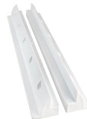
Halter-Set 550 mm EMO10072