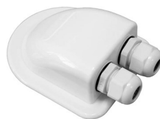
2-Wege Kabeldurchführung EMO10067